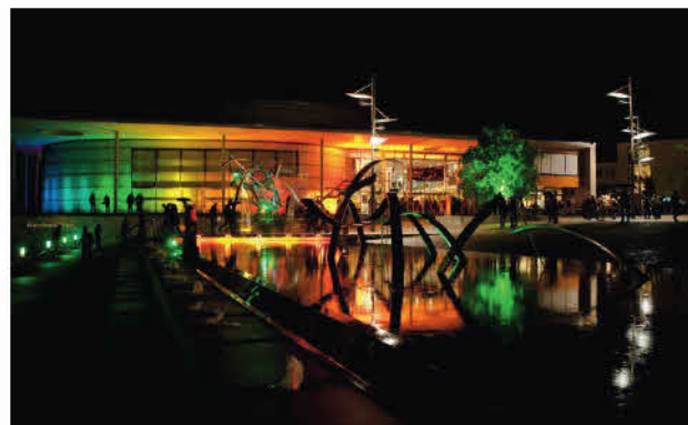
Lichtinstallation aus der Sicht von Chris Liebold