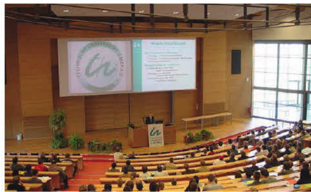
Audimax des Humboldtbaus