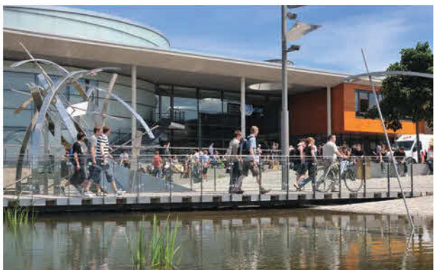
Humboldt Bau